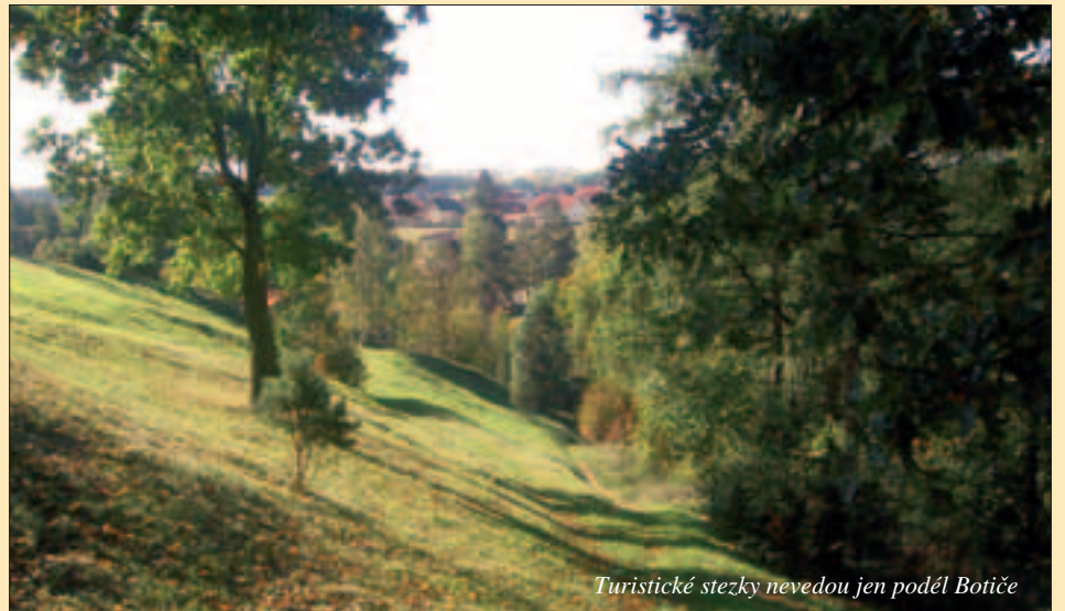
Turistické stezky nevedou jen podél Botiče