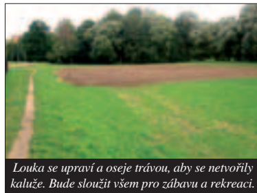
Louka se upraví a oseje trávou, aby se netvořily kaluže. Bude sloužit všem pro zábavu a rekreaci.

Někteří sportovci na louce provozují rekreační fotbal, hrají si zde i děti, avšak na ploše jsou prolákliny, které vznikly při rovnání louky v roce 1996 po stavbě čerpací stanice odpadních vod. V proláklinách se po dešti drží voda. Zastupitelstvo Křeslic tedy rozhodlo, že v rámci dotace se louka srovná se spádem k potoku podle návrhu ing. arch. Bendové, to je do původního stavu před rokem 1996. Plocha bude pak znovu oseta trávou. Dosaпанá vrstva není silná, ale úprava je ve velké ploše. Dosaпанí zeminy bylo přerušeno, protože 16. září na louce proběhne zábavné odpoledne pořádané křeslickou radnicí. Pak se akce dokončí. Další úprava, která bude provedena, je prodloužení havarijního přepadu čerpací stanice odpadních vod do potoka. Po provedených úpravách budou moci zájemci daleko lépe než dosud využívat tuto plochu pro zábavu a odpočinek.