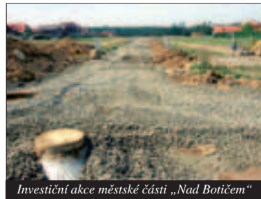
Investiční akce městské části „Nad Botičem“