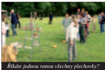
Ríkáte jednou ranou všechny plechovky?