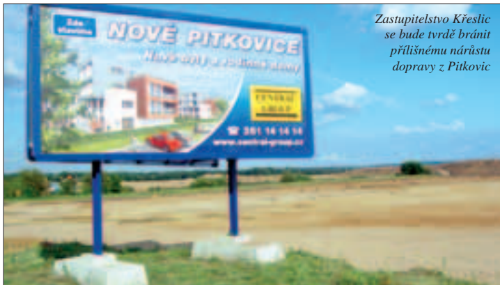
Zastupitelstvo Křeslic se bude tvrdě bránit přílišnému nárůstu dopravy z Pitkovic