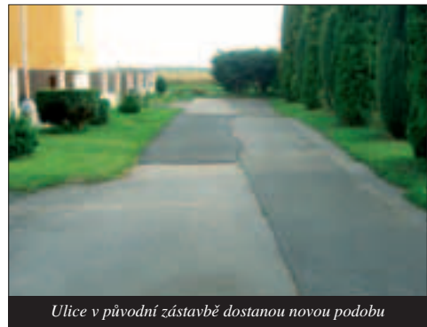
Ulice v původní zástavbě dostanou novou podobu

Na rekonstrukci ulic je vydáno pravomocné územní rozhod-