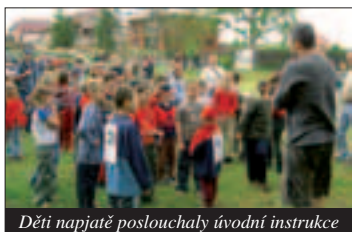
Děti napjatě poslouchaly úvodní instrukce