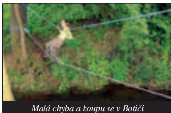
Malá chyba a koupou se v Botiči