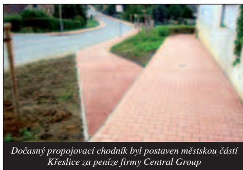
Dočasný propojovací chodník byl postaven městskou částí Křeslice za peníze firmy Central Group

kvalitě komunikací a investor postupně provádí opravy. Byla např. předělána většina kanalizačních poklopů, aby dešťová voda nevětkala do splaškové kanalizace a nepřecherpalava se spolu se splašky do pražské kanalizační sítě. Podmínkou bylo také propojení chodníků ve Štychově ulici (dočasného z obce a definitivního podél nové zástavby). Firma Central Group požádala městskou část Křeslice, aby propojení chodníků vybudovala za jejich peníze, protože pozemek je ve vlastnictví Prahy a jednání na magistrátě jsou zdlouhavá. Stavbu chodníku Křeslice zajišťují a nyní již slouží svému účelu.