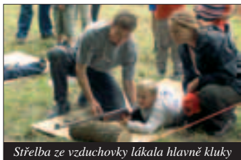
Střelba ze vzduchovky lákala hlavně kluky