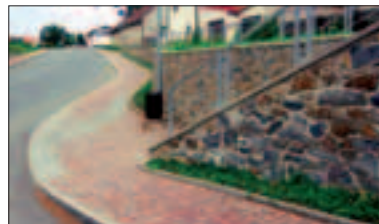
Historický pohled na zahájení akce „Za Ovčínem“. Nyní jsou již sítě i ulice hotové.

Křeslice se věnují podnikatelské činnosti, při které získávají pozemky, zhodnocují je a následně prodávají, nebo mají zisky ze zhodnocování pozemků jiných vlastníků. Práce s tím spojená je obrovská. Vždyť suplujeme developerské a stavební firmy se vším všudy: V oblasti návrhů a projektů inženýrských sítí a vozovek, obstarávání stavebních řízení, smluvních vztahů s klienty a správci inženýrských sítí, výběrových řízení a vlastní výstavby, kolaudace, převodů inženýrských sítí na jejich držitele a mnoha dalších kroků. Počet smluv, jednání a zápisů jde do stovek. Jen při podpisování smluv v lokalitě „Nad Botičem“ jsem strávil několik dní v notáře a počet smluv jde do stovek. To je jen jedna z akcí. Na většinu odborných činností si najímáme specialisty, ale s nimi jsou uzavírány další smlouvy. Denně se něco projednává, řeší, spisuje. Na úřadě je několik let velmi živo.