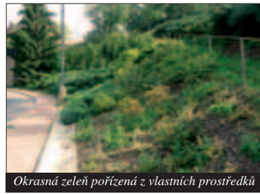
Okrasná zeleň pořízená z vlastních prostředků