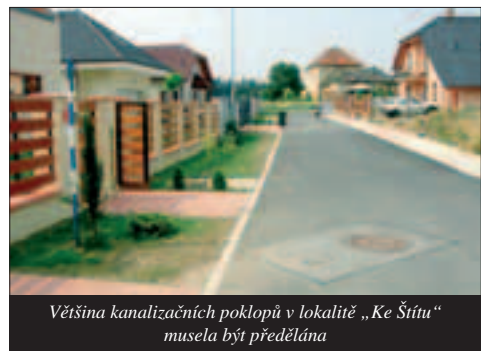
Většina kanalizačních poklopů v lokalitě „Ke Štítu“ musela být předělána

Kolaudace komunikací v lokalitě „Ke Štítu“ probíhá již od konce roku 2005. Zástupci Křeslic vznesli řadu připomínek ke