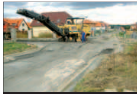
Až po roce se podařilo prosadit opravu povrchu Mátové ulice

Hluk a prach byly sice nepřijemným jevem probíhajících oprav, ale bezproblémové fungování ulice za to rozhodně stojí. Městská část Křeslice bude ještě požadovat v souladu se znaleckým posudkem, který si dala vypracovat, propojení dešťových vsakovacích studní drenážním potrubím s uličními vpustěmi, nebo šterbinovou sběrač podél obrubníků a na žádost občanů i výměnu zeminy v plochách zeleně za humózní pro lepší vsakování dešťových vod.