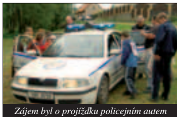
Zájem byl o projíždku policejním autem