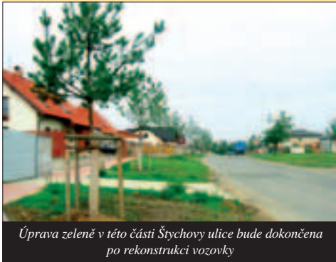
Úprava zeleně v této části Štychovy ulice bude dokončena po rekonstrukci vozovky

Jejich vysázení zajistila na své náklady městská část Praha – Křeslice. Jedná se o šestnáctileté sazenice dovezené z Německa. Rozhodnutí pro jehličňany padlo z toho důvodu, že jejich zeleně bude zdobit obec po celý rok i v zimě. Jde také o praktický důvod. Na podzim se nemusí uklízet kvanta listů, jako z opadavých stromů. Výsadbu provedla firma Marigreen s pětiletou zárukou, která nám dává dostatek jistoty ve vydanou investici. Zeleně v tomto úseku Štychovy ulice není dokončena. Věříme, že stromy v impozantních alejích budou dobře prosperovat.