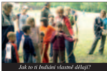
Jak to ti Indiáni vlastně dělají?