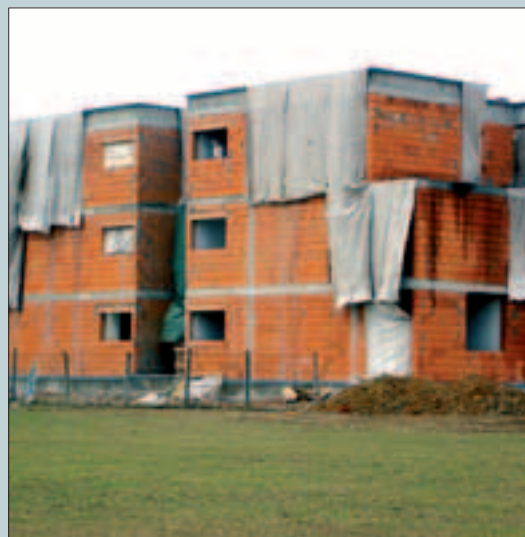
Výstavba bytových domů, výhodná pro investory, zvyšuje oproti rodinným domům dopravní zatížení až desetkrát. Výstavba v Újezdě (na obrázku) navíc slouží k nátlaku na vznik křižovatky v trase JVK na brněnské dálnici

Ostatní nebyli přítomni, nebo nehlasovali