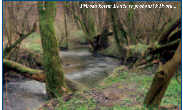
Příroda kolem Botiče se probouzí k životu...