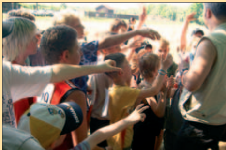
Dětský den probíhal jako každoročně na louce u Botiče. Chutí si hrát a soutěžit nikomu nechyběla.