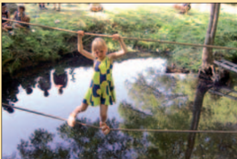
Botič není řeka, ale na laně bývá všechno jinak...