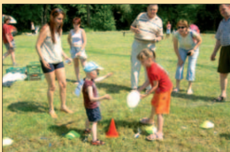
Tátové a mámy z Křeslic fandili a ochutnávali grilované maso s dobrým pitím