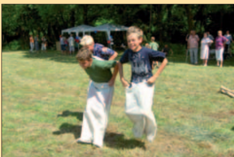
... a děti si užívaly počasí, soutěží i zasloužených výher v podobě sportovního náčiní a hraček