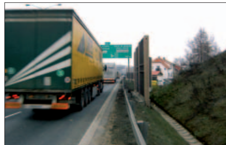
Ukázka na Jižním Městě (Chodov), jak blízko může vést dálnice od obytných domů. Volný koridor v Křeslicích je široký 200m

V Petrovickém zpravodaji, speciálním čísle, se dušoval náместek Bürgermeister, že komunikace v trase JVK skončí na brněnské dálnici a nikdy nebude dál pokračovat kolem Milíčovského lesa. Tvrdil, že koridor za Milíčovským lesem a kolem Křeslic a Petrovic již neexistuje. Tuto myšlenku potvrdil i JUDr. Červenka, překupník pozemků ve velkém a vlastník rozsáhlého území v Újezdě. Uvedl, že tam nelze vést komunikaci, protože jsou tam „dráty, trubky a roury“.