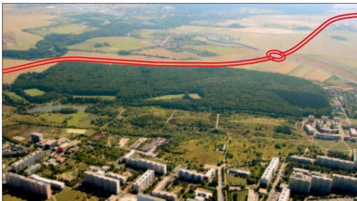
Pohled z Jižního města přes Milíčovský les na koridor, který magistrát udržuje stále volný