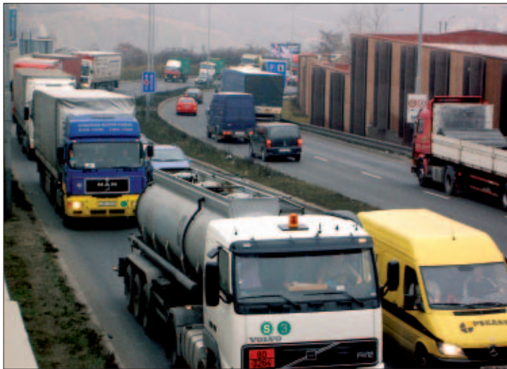
Běžný provoz na Barrandovské spojkě. Stejná parametry má navržená Vestecská spojka v trase JVK