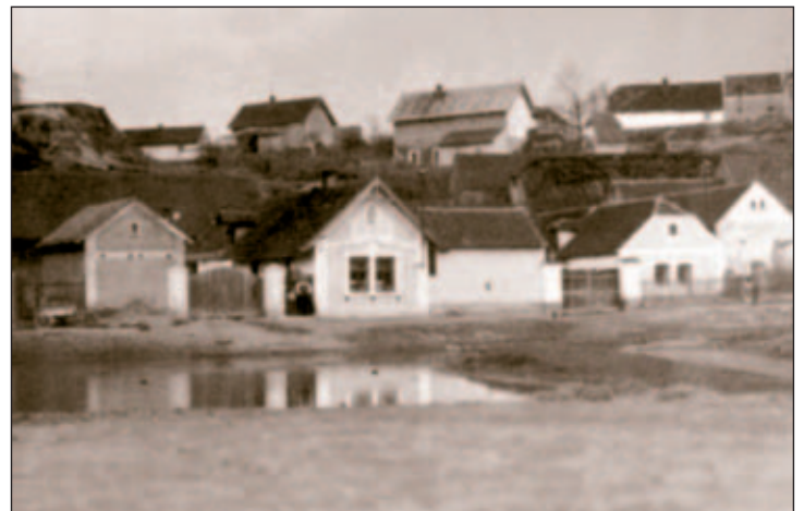
Dolní Křeslice, pohled od bývalé návsi, foto z padesátých let

Před postavením okresní silnice v roce 1879 procházela křeslickou obcí krkolomná cesta. Nejbližší železniční stanicí se stala Uhrňevěs a od roku 1926 Horní Měcholupy. V 30. letech vedla již ke Křeslicím moderní okresní silnice, v roce 1931 byla zřízena soukromá autobusová linka Velké Popovice – Královské Vinohrady, která projížděla také Křeslicemi. Elektrizace byla provedena v roce 1928 a zároveň bylo zřízeno veřejné osvětlení obce. (J.K.)