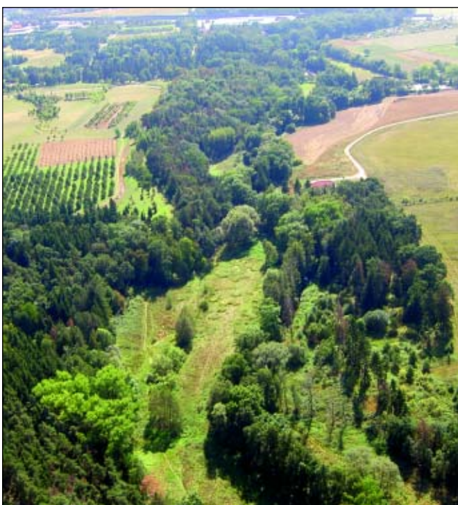
Jeden z pozemků v údolí Botiče o který se MČ Křeslice soudí