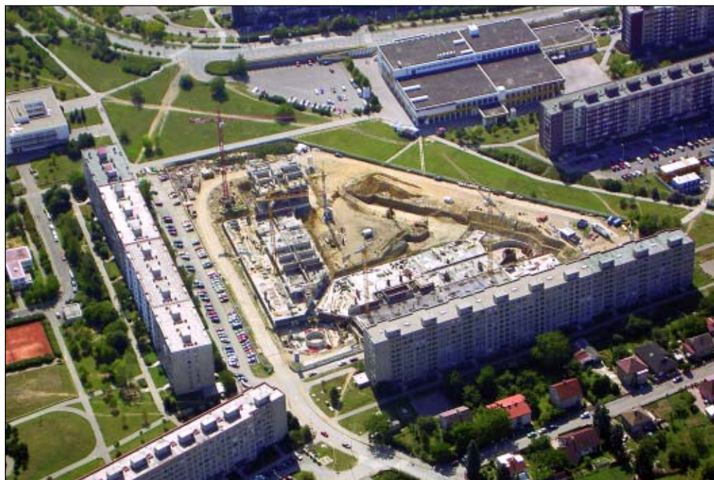
Téměř úplné zastavení Veronského náměstí v Praze 15, Horních Měcholupech