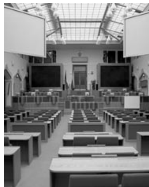
V tomto sále na Magistrátu se rozhoduje centrálně o rozvoji ve všech městských částech v Praze. Často přes nesouhlas a protesty obyvatel a volených zástupců těchto městských částí.