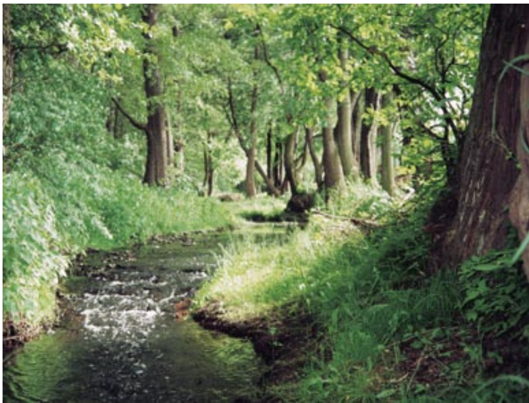
Taková zákoutí nabízí příroda v údolí Botiče