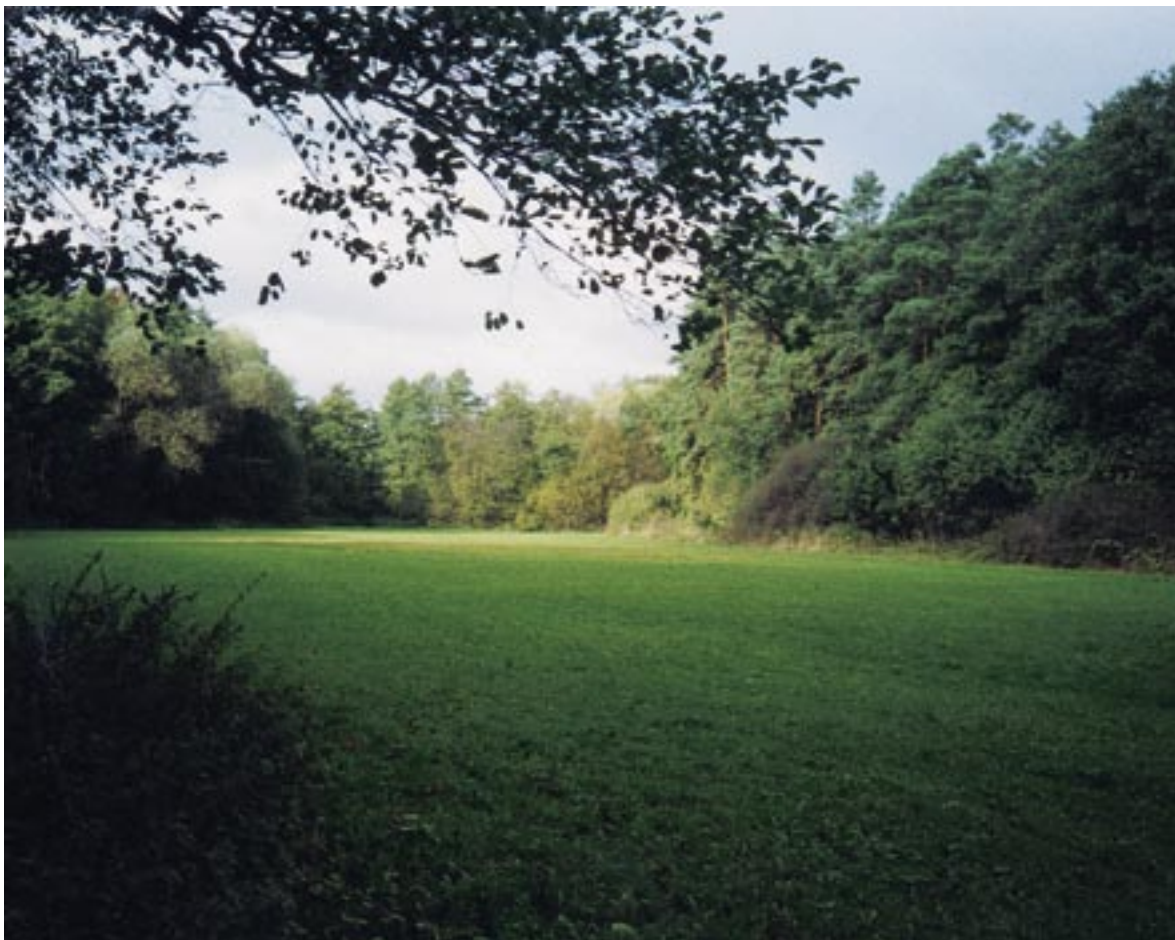
Louky v údolí Pitkovického potoka

První cyklista se objevil na světě 12. července 1817: Baron von Drais usedl na svůj velocipéd a vzdálenost 14,4 km urazil na „běhacím stroji“, který poháněl odražením nohou od země, za jednu hodinu. O rok později chtěl svůj vynález představit světu v Paříži, ale neschopný jezdec obrátil triumf v trapnou frašku. Skutečnou cestu ke slávě začala Draisovo kolo obohacené o šlapací pohon až o padesát let později. O 120 let později spatřilo světlo světa horské kolo.