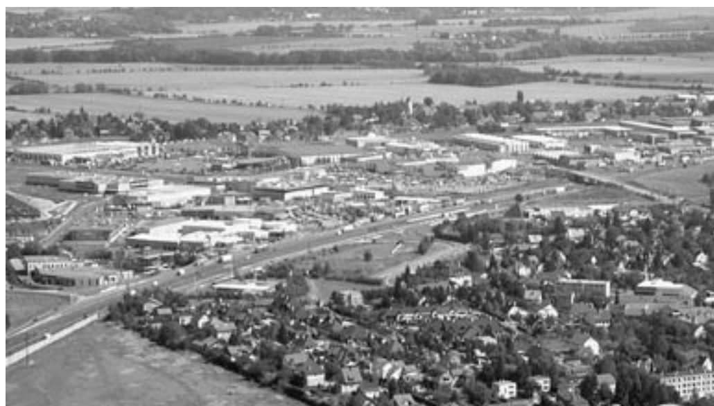
Nákupní areály v Čestlicích. Myslíte, že nám tyto hypermarkety nestačí?

Občanské sdružení OPTIM-EKO uspořádá v říjnu podpisovou akci proti křižovatce a komunikaci v trase JVK. Prosíme, podpořte svým podpisem žádosti městských částí Křeslic, Újezda a Petrovic o definitivní zrušení těchto návrhů. Sledujte informace o podpisové akci ve svém okolí a pomozte zachránit území kde žijeme – jihovýchod Prahy.