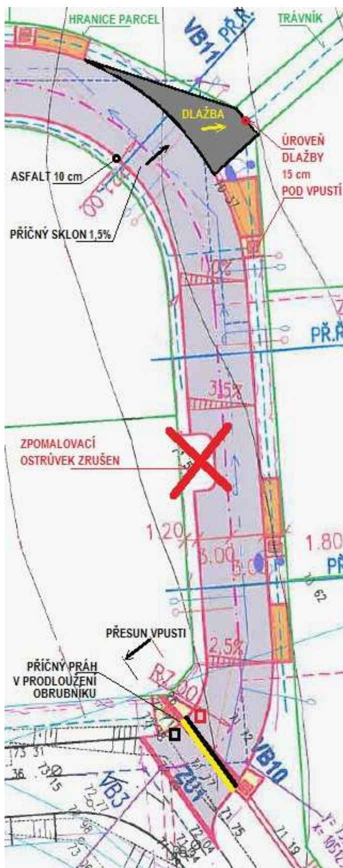
Obr. 2 – detail severní části lokality Za Ovčínem II

Nebude realizován zakreslený zpomalovací práh přes ul. Pod Ovčínem a zpomalovací ostrůvek v severovýchodní části.